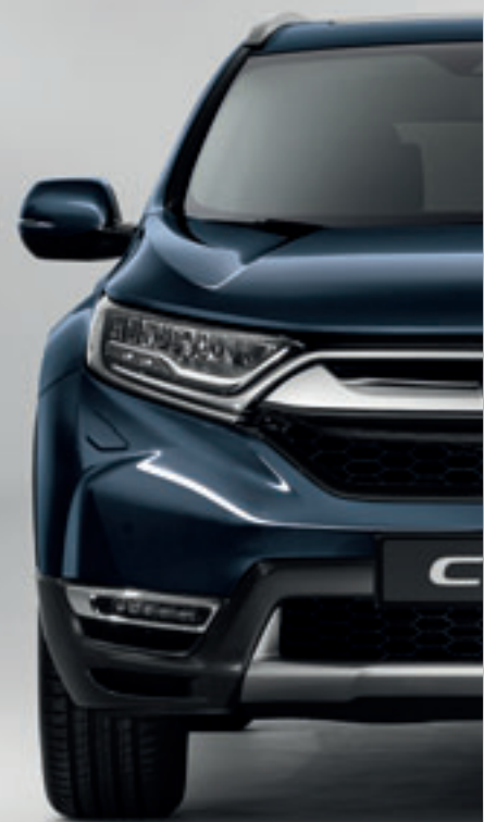
COSMIC BLUE METALLIC