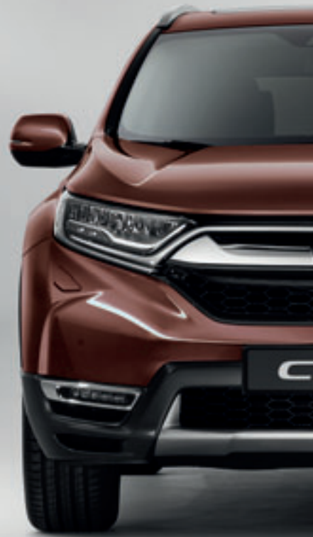
PREMIUM AGATE BROWN PEARL