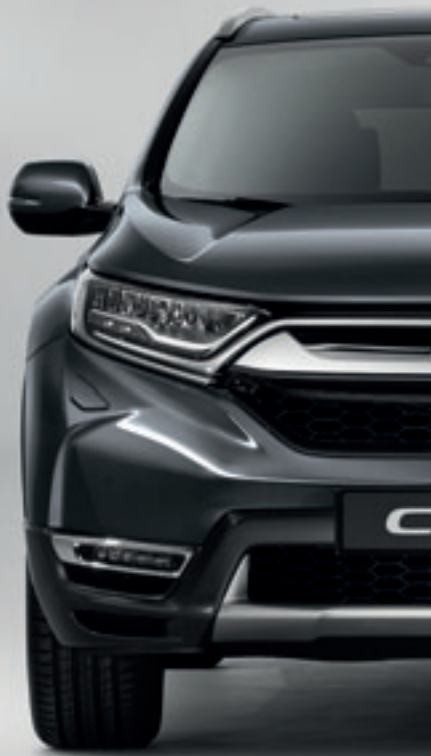
MODERN STEEL METALLIC