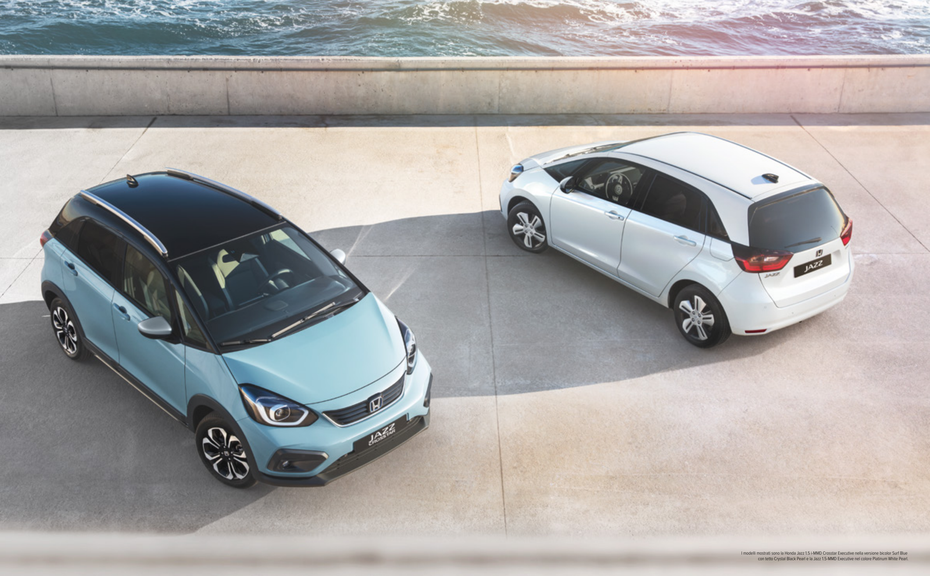
I modelli mostrati sono la Honda Jazz 1.5 i-MMD Crosstar Executive nella versione bicolor Surf Blue con tetto Crystal Black Pearl e la Jazz 1.5-MMD Executive nel colore Platinum White Pearl.