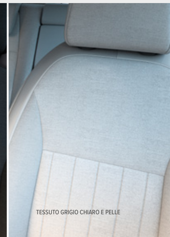
TESSUTO GRIGIO CHIARO E PELLE