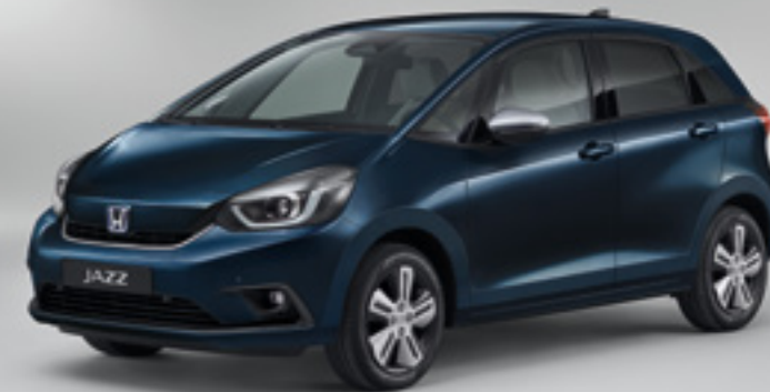
MIDNIGHT BLUE BEAM METALLIC