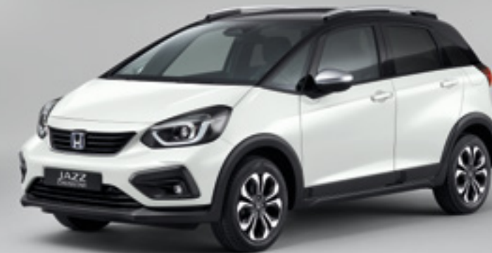
PLATINUM WHITE PEARL / BICOLOR