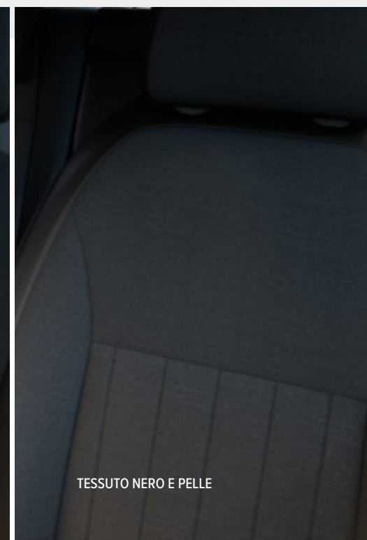
TESSUTO NERO E PELLE