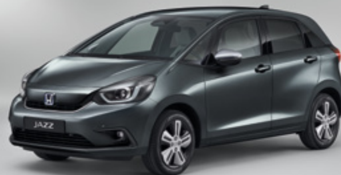
SHINING GRAY METALLIC