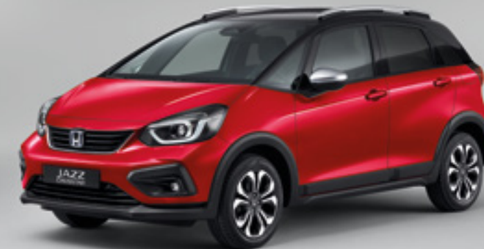
PREMIUM CRYSTAL RED METALLIC / BICOLOR

Il modello mostrato è la Jazz Crosstar 1.5 i-MMD Executive. Il colore Surf Blue e la scelta di versioni bicolor sono disponibili solo sulla Jazz Crosstar.