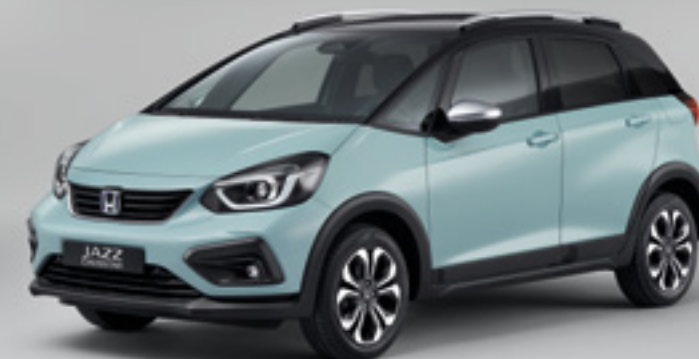
SURF BLUE / BICOLOR