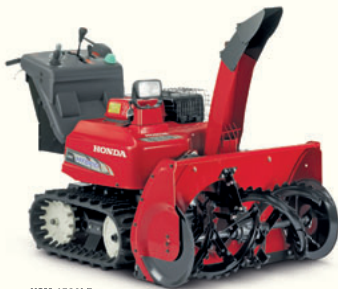
HSM 1590i E