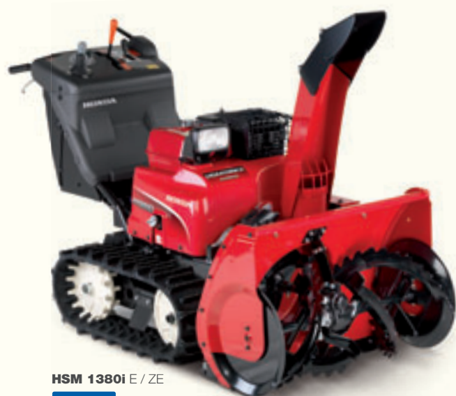
HSM 1380i E / ZE