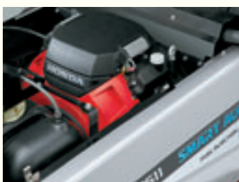
Motore a iniezione

Funzioni come la trasmissione idrostatica, l'avviamento elettrico, la grande luminosità del faro e il contatore fanno sì che il modello HSL 2511 sia sempre contraddistinto dalla massima semplicità e comfort di utilizzo. I nostri ingegneri hanno posto grande impegno sugli aspetti ergonomici, per far sì che ciascun sistema sia caratterizzato dalla massima semplicità e intuitività. Le funzionalità aggiuntive, come il sistema di gestione automatica della coclea, consentono all'utente di concentrarsi tranquillamente sull'uso della macchina.