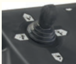
Camino di espulsione con controllo a joystick

Caratterizzati da robustezza, affidabilità e prestazioni elevate, i modelli della Serie 9 sono stati progettati per trattare vaste aree innevate in modo semplice ed efficiente.