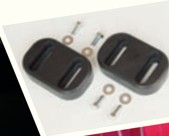
Kit piastre di protezione coclea