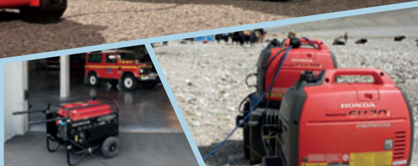
Generatori Honda - potenza pulita e trasportabile