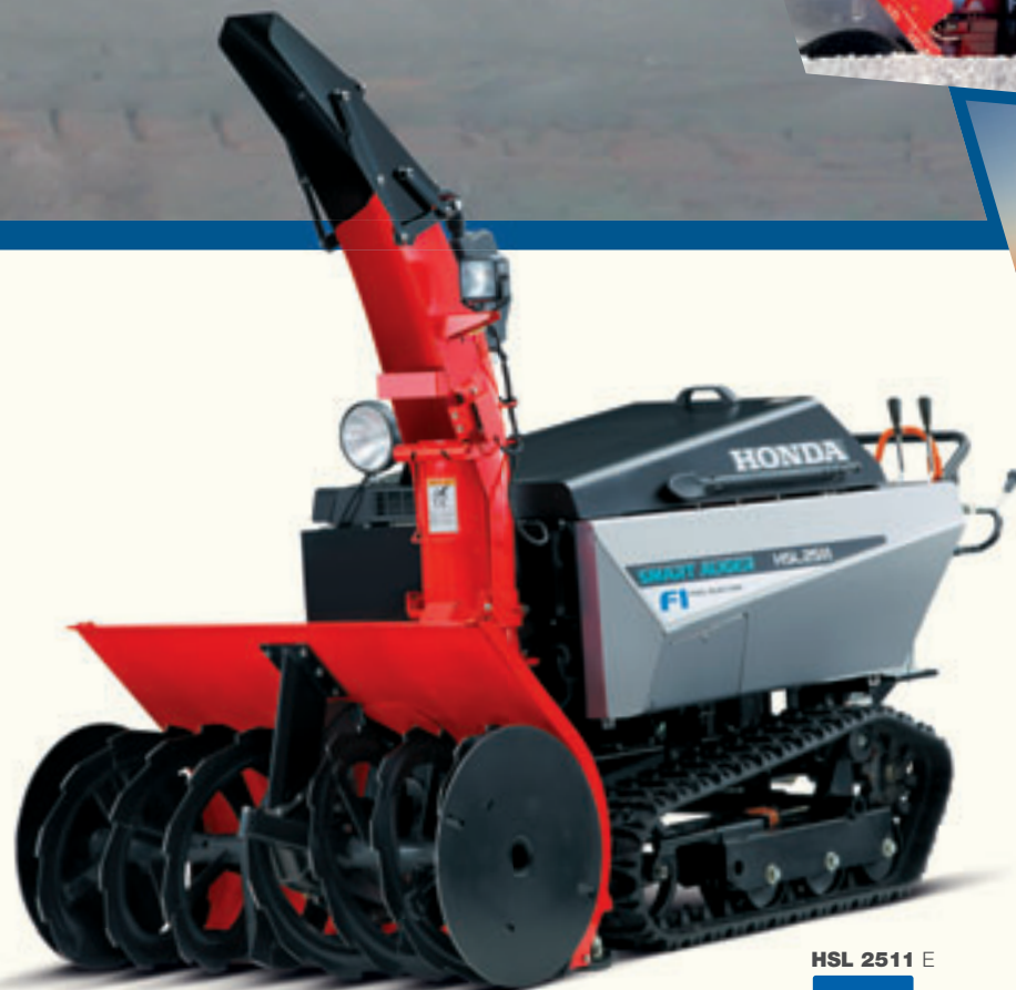
HSL 2511 E